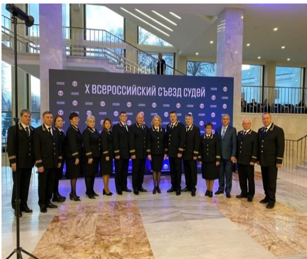
Делегаты X Всероссийского съезда судей от Хабаровского края

Во второй день съезда были заслушаны доклады делегатов, а также тайным голосованием переизбраны члены органов судейского сообщества: Совет судей Российской Федерации, Высшая квалификационная коллегия судей Российской Федерации, Высшая экзаменационная комиссия по приёму квалификационного экзамена на должность судьи.