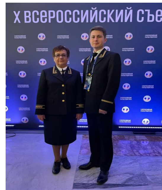
Делегаты X Всероссийского съезда судей награждены юбилейными медалями

Одно из нововведений съезда – служебное обмундирование для судей. В соответствии с изменениями, внесенными 16 апреля в статью 19 Закона Российской Федерации от 26 июня 1992 года №3132-1 «О статусе судей в Российской Федерации», судьи обеспечиваются не только мантиями.